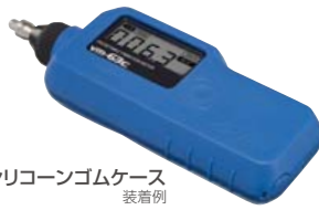
シリコンゴムケース 装着例