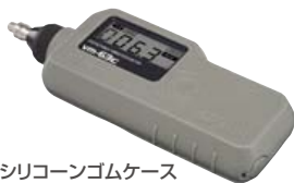
シリコンゴムケース 装着例