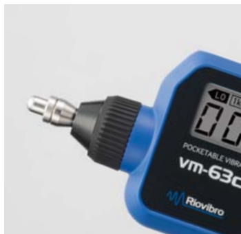
付属 (出荷時の状態)

VM-63Cの振動検出部は、測定用途によりアタッチメント(S、L、アタッチメントなし)を使い分けることができます。