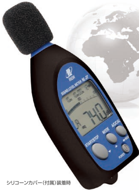
シリコンカバー(付属)装着時