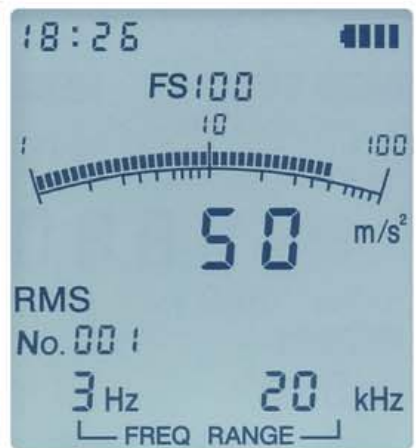
バックライトの点灯