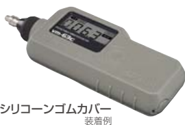
シリコンゴムカバー 装着例