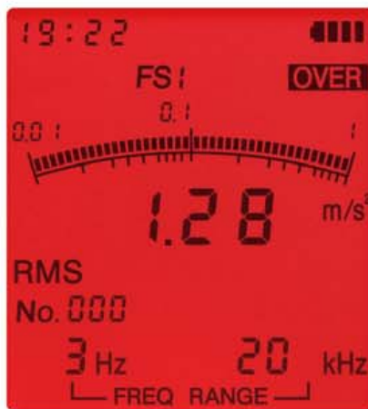
オーバーロード画面