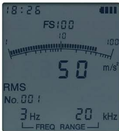
測定データの表示画面

液晶画面にはバークラフと数値が同時に表示され、変動の様子を容易に把握。設定した周波数範囲などの情報も表示し、バックライト機能により暗所でも内容を確認できます。オーバーロードの状態になると、OVERが表示され、液晶全体が赤色に変わります。