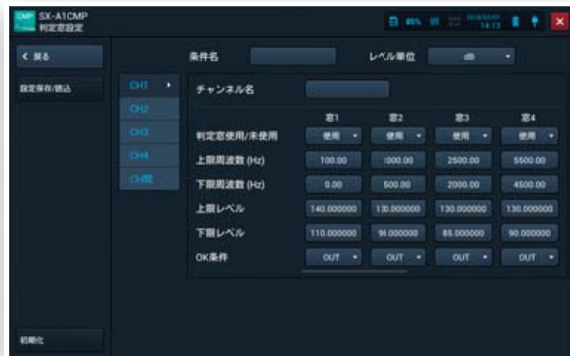
判定条件設定画面