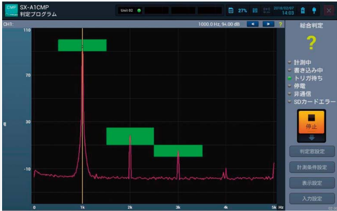
1チャンネル判定画面 (Peak判定)