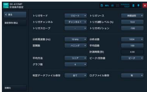
計測条件設定画面